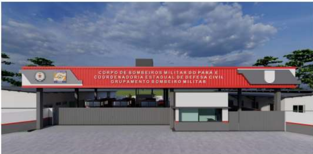
Figura 06 – FACHADA.