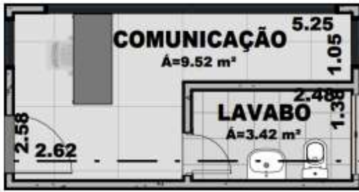
Figura 04 – COMUNICAÇÃO