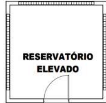
Figura 05 – RESERVATÓRIO