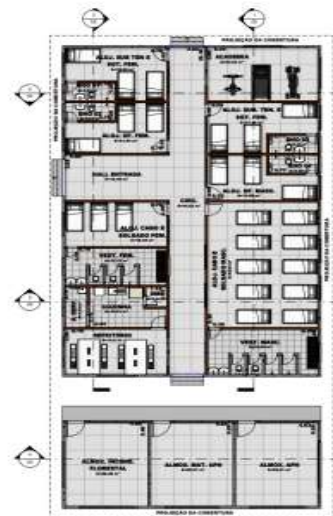
Figura 03 – SAT/REDEC