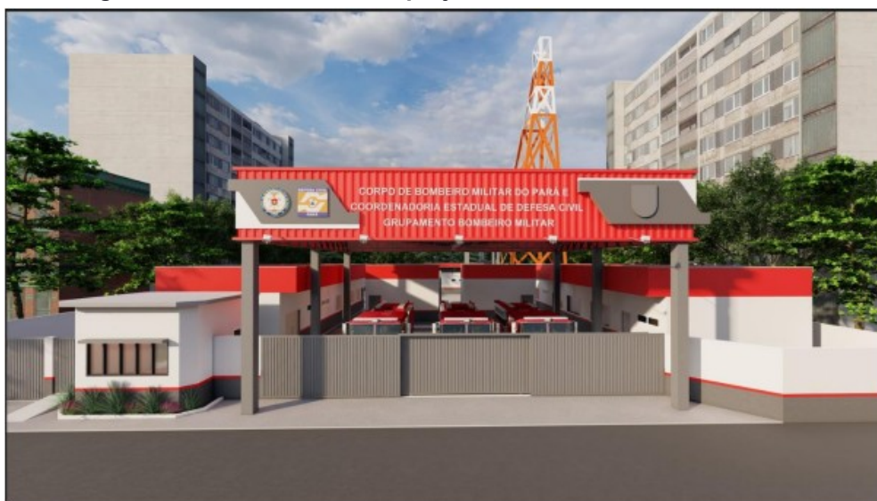
Figura 02 – Layout do projeto referente ao GBM em Oriximiná