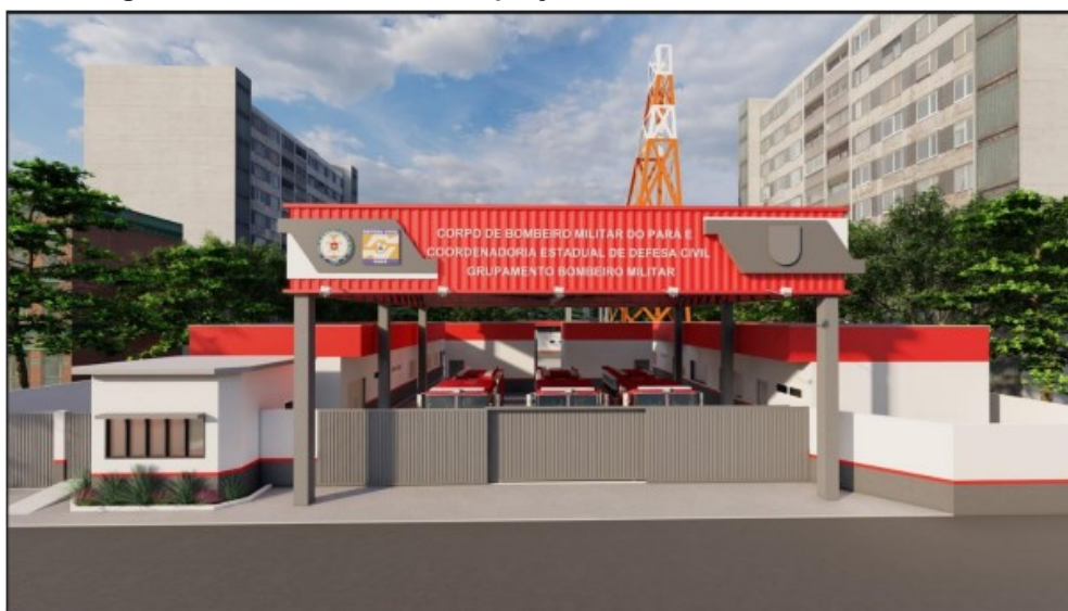
Figura 02 – Layout do projeto referente ao GBM em Oriximiná