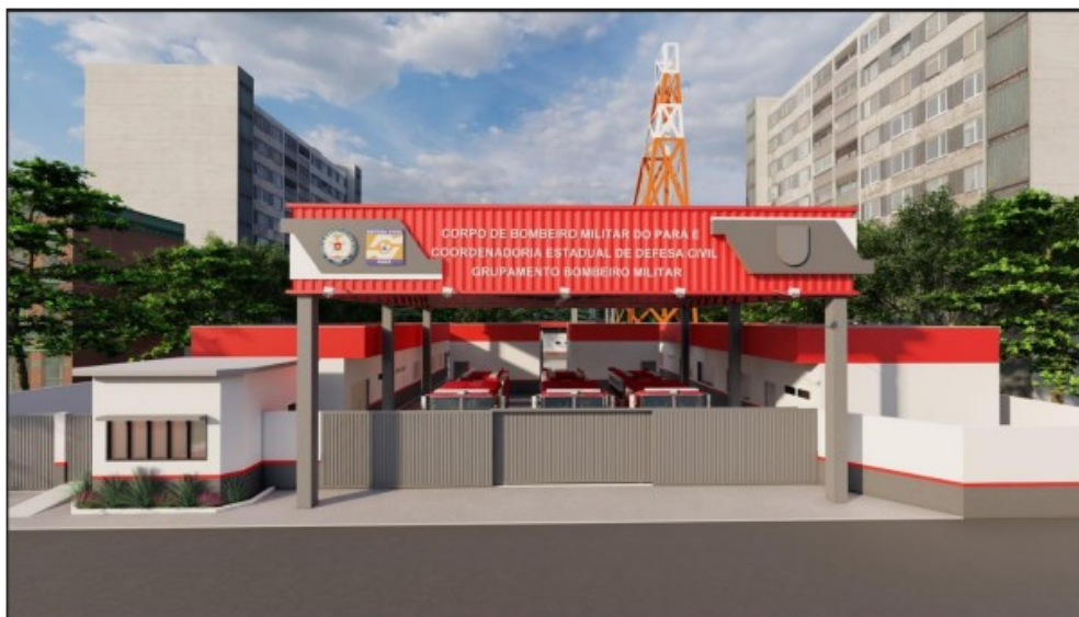
Figura 02 – Layout do projeto referente ao GBM em Oriximiná