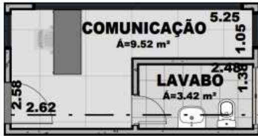
Figura 04 – COMUNICAÇÃO