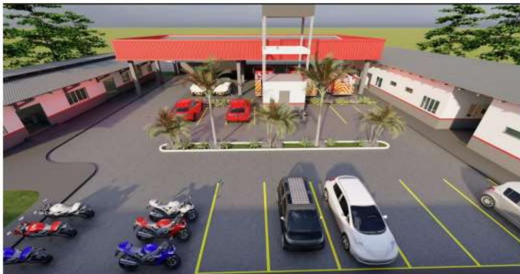
Figura 07 – RENDERIZAÇÃO.

4.2.2 Na qual nesse processo será realizada o GRUPO MILITAR DE ALMEIRIM .