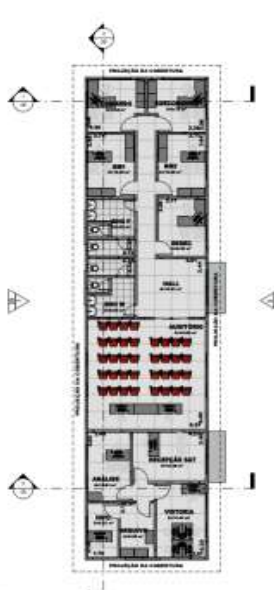
Figura 02 – BLOCO DE ALOJAMENTOS