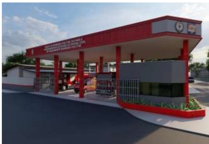
Figura 02 – Layout do projeto referente ao GBM em Novo Progresso