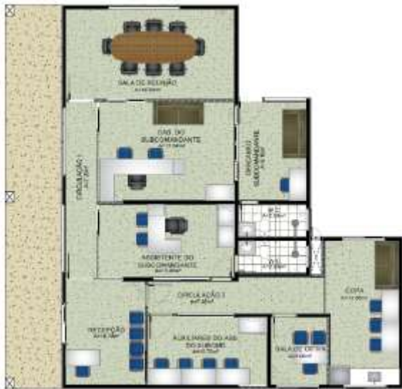
Figura 01 – GABINETE DO CHEFE DO EMG.

4.2.1 As especificações e quantitativo do material encontram-se detalhadas abaixo. 4.2.2 O empreendimento onde funcionará a III etapa da Reforma com Ampliação do Quartel do Comando Geral do CBMPA apresenta uma área somada (construção) de aproximadamente 1100,93 m². Apresentando partido arquitetônico singular e concepção estrutural convencional, em concreto armado, caracterizando-se como edificação institucional, conforme figura abaixo.