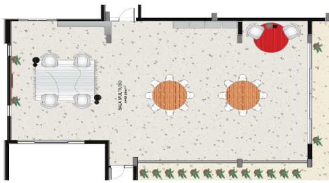
Figura 05 – SALÃO MULTIUSO.

4.3 Na qual nesse processo será realizada a III Etapa de Reforma com Ampliação do Quartel do Comando Geral do CBMPA.