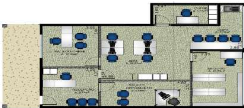
Figura 04 – BM2