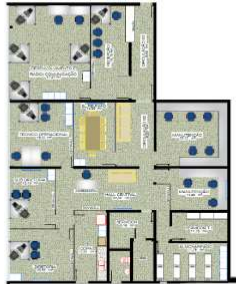
Figura 02 – DTE.