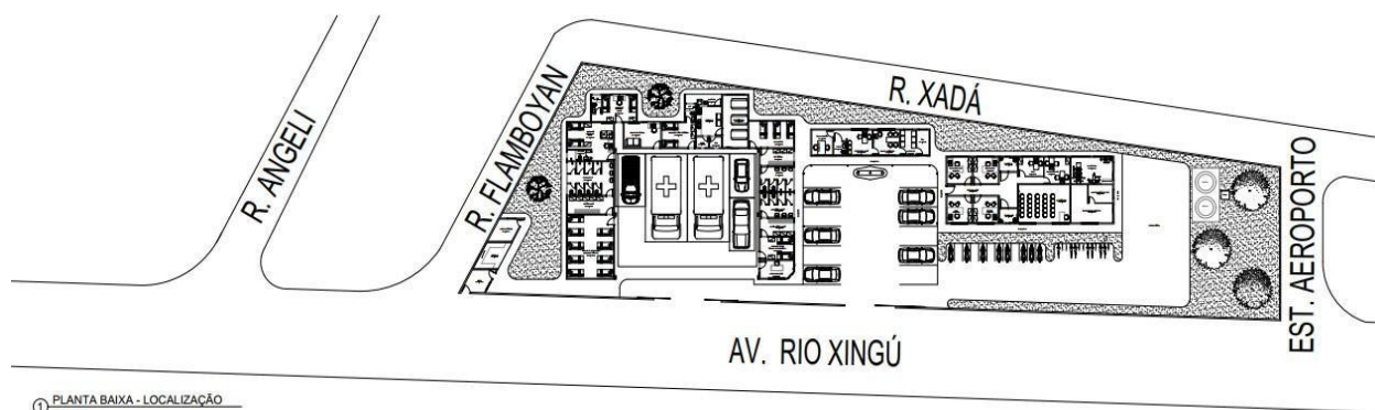
Figura 01: Planta Baixa de Localização

4.2.2 O empreendimento onde funcionará o Grupamento de Salvamento e Resgate apresenta uma área somada (construção) de aproximadamente 2028,00 m 2 . Apresentando partido arquitetônico singular e concepção estrutural convencional, em concreto armado, caracterizando-se como edificação institucional, conforme figura abaixo: