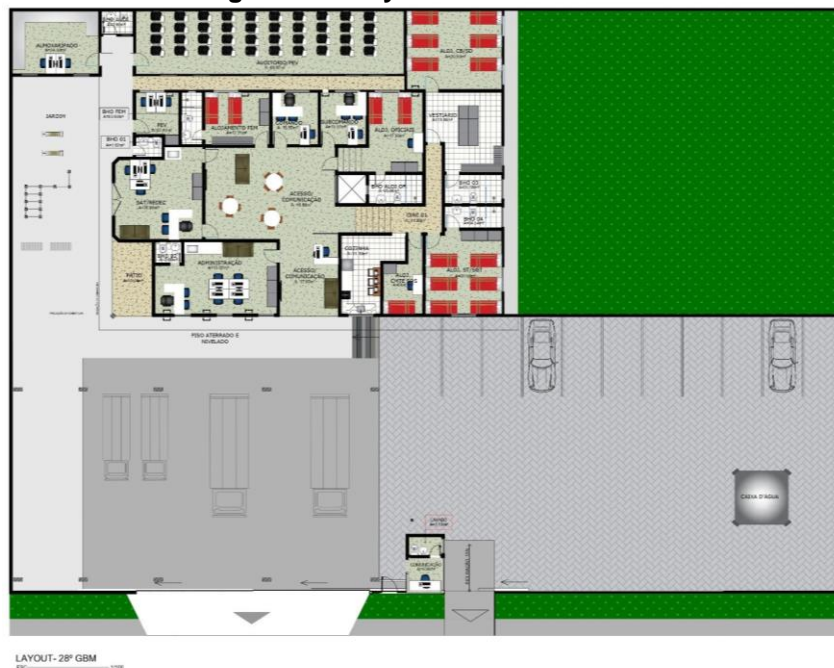
Figura 01 – Layout Humanizado do 28° GBM.

5.2.2 O empreendimento onde funcionará a REFORMA E AMPLIAÇÃO DO 28° GBM - SÃO MIGUEL DO GUAMÁ apresenta uma área somada (construção) de aproximadamente 1750m^2 . Apresentando partido arquitetônico singular e concepção estrutural convencional, em concreto armado, caracterizando-se como edificação institucional, conforme figura abaixo.